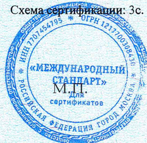
Схема сертификации: Зс.